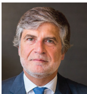
/ Rui Medeiros